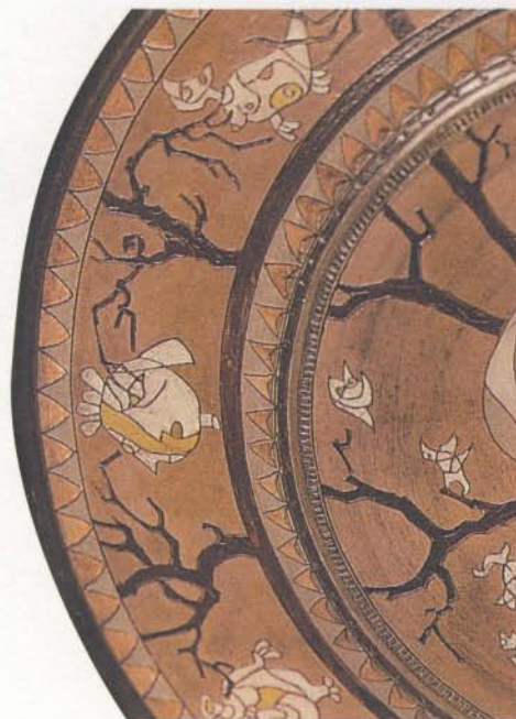
Fragment 'Broedend', keramiek doorsnede 50 cm, 1996

Hij heeft echter goede hoop dat de wal het schip eens zal keren. Van het vertrouwen dat de natuur niet met zich laat spotten geeft hij ook in keramiek menigmaal blijk. Zo kijkt de tot ei vereenvoudigde figuur op een boomtak, broedend