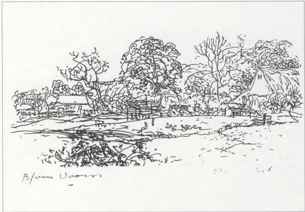
'Yde', ets 13 x 9 cm, 1981