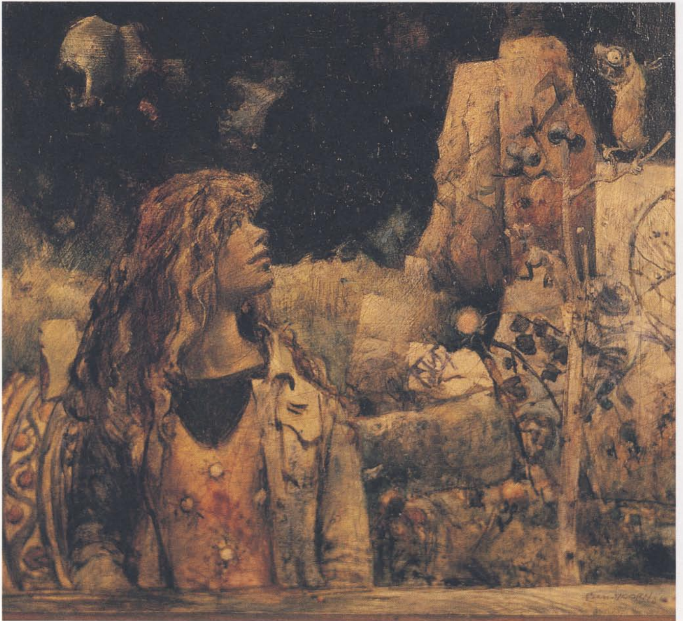
'Marianne', olieverf, 17 x 15 cm, 1979