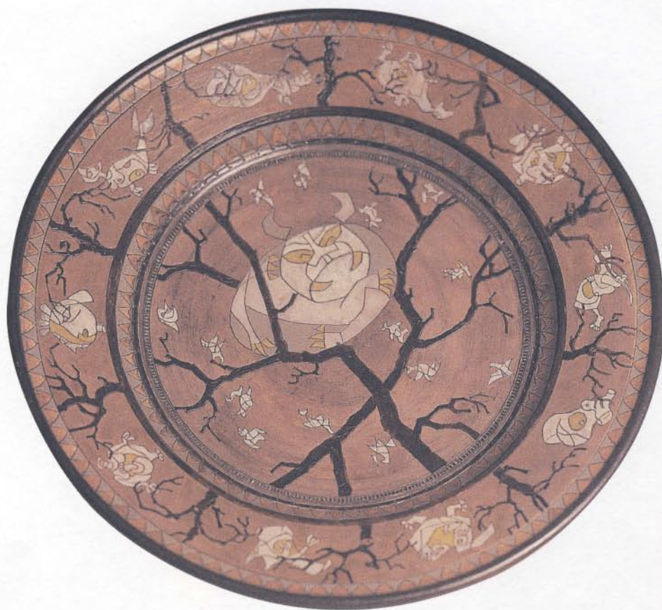
'Broedend', keramiek doorsnede 50 cm, 1996