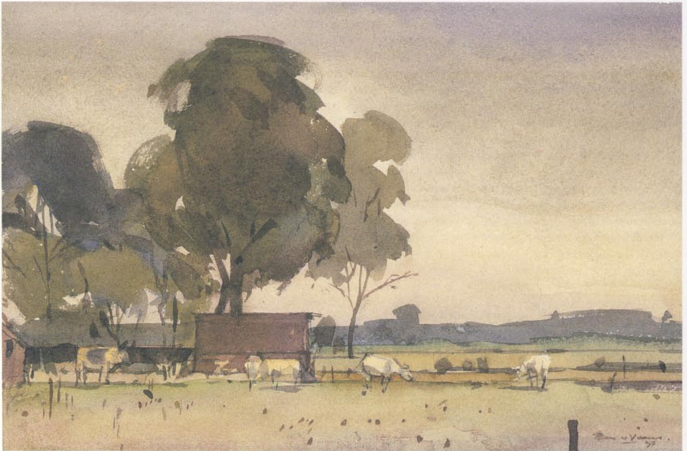
'Hollandsche veld', aquarel 29 x 20 cm, 1997

In de tuin staat de zon laag. De tuin is bronzen beelden, olieverven en de vijvers aquarel.